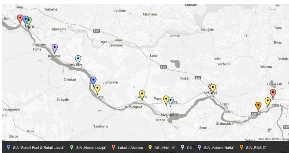
2.attēls. DUS izvietojums pie autoceļa A6