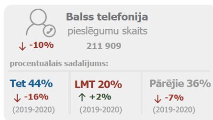
3. attēls Fiksētās balss telefonijas pakalpojuma sadalījums 2020. gadā